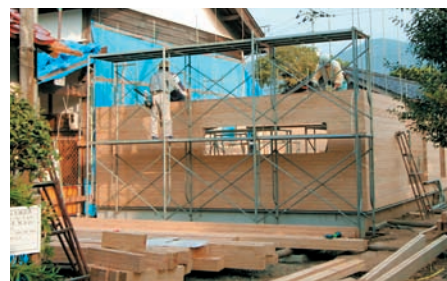
HOUSE H(島根県) 山代悟 / ビルディングランドスケープ