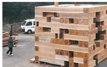
モクバン(熊本県) 佐藤淳 / 佐藤淳構造設計事務所